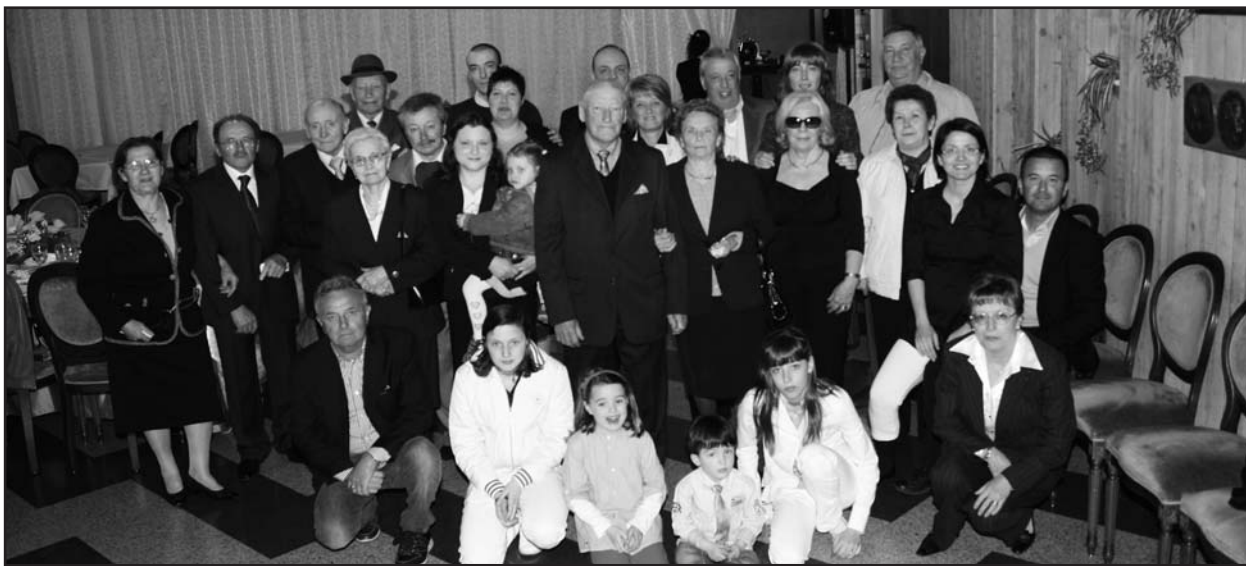
Al centro i coniugi Danesi con la numerosa parentela.