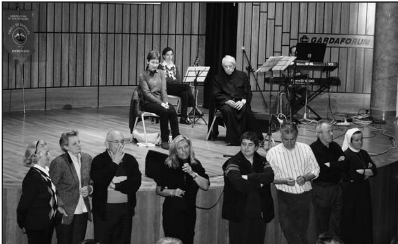
Toccanti testimonianze alternate alle rappresentazioni.