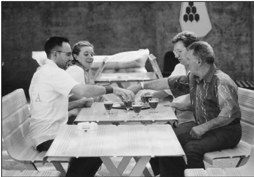
La famiglia Goffi al bar in un momento di relax.